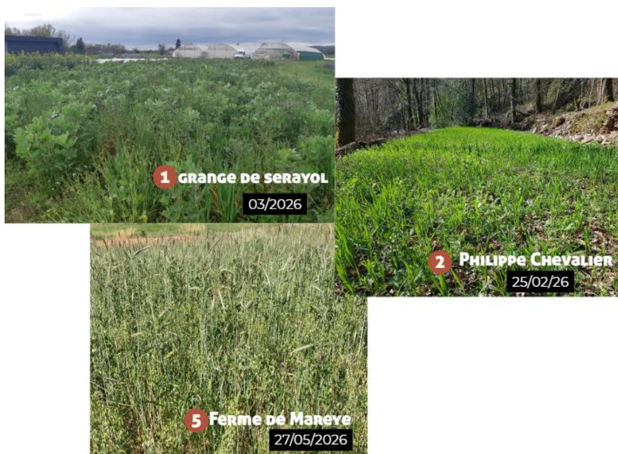
Couverts végétaux réussis sur les fermes 1 et 2 juste avant destruction

Les essais sur les fermes 1, 2 et 5 présentent des couverts bien implantés et une couverture du sol satisfaisante estimée supérieure à 80%. Dans ces trois essais, la date d'implantation est variable (Septembre à Décembre) avec un travail du sol en amont (au disque déchaumeur et/ou vibroculteur et/ou motoculteur) et un passage de rouleau après semis.