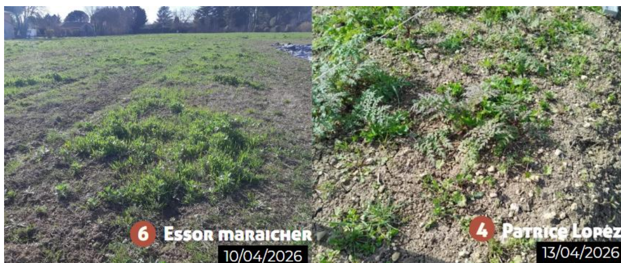
Couverts végétaux peu concluants sur les fermes 4 et 6 juste avant destruction